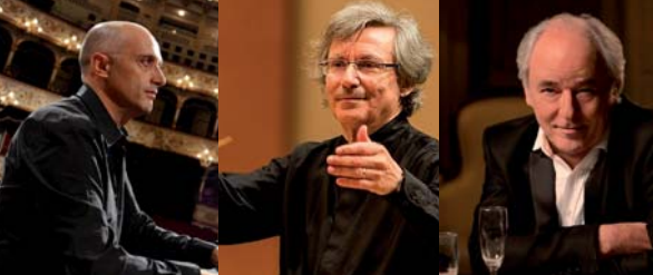
Benedetto Lupo / D.R. Jean-Jacques Kantorow © K.Miura Maxime Le Forestier / D.R.

Ce festival est organisé par l'association des Petites Cités de Caractère de la Vendée. Chaque soir, les artistes se produisent dans le cadre remarquable des six cités dont le patrimoine est tout particulièrement mis en valeur à cette occasion.