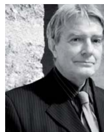
Michel Laplénie

Sagittarius reçoit le soutien de l'Etat (Ministère de la Culture / DRAC Aquitaine), du Département de la Gironde, de la Région Aquitaine et de la Ville de Blaye.